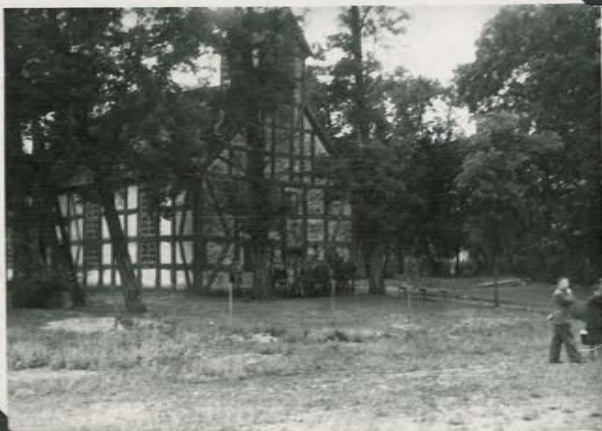
Kościółek w Przechodzie.