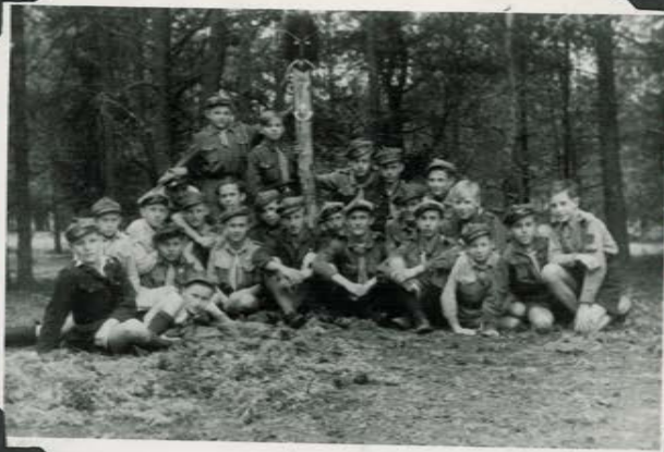
"Punera" priy "Balli".