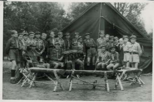
"Punera" priy Kean Padu".