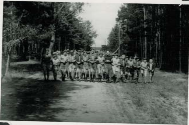
Powrót z Breborowa.