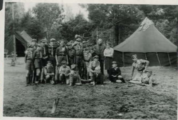
"Puszcza" przy "Jeleniu".