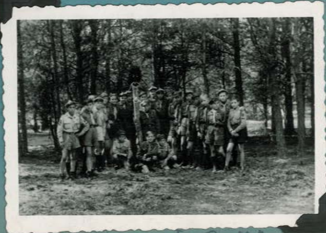
"Injera" wokolo Polki.