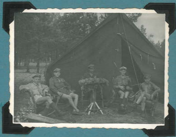
"R.O. "Puszcza" - 1948 rok"