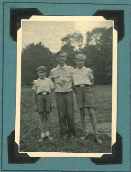
„Obóz harcerski: Kwiler, Rosłitek” lato 1945 rok w Rosłitku.