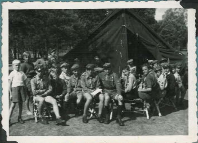
"Injera" przed Komenda.