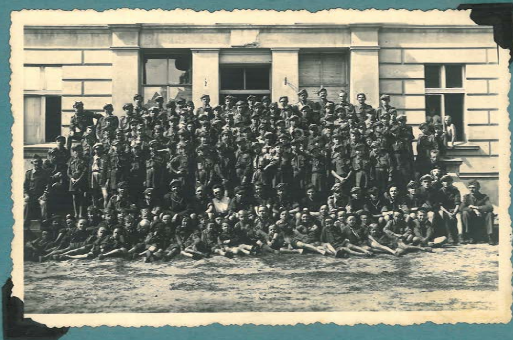
Jaszłowo k/Sremu 1947r.