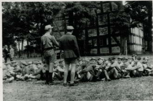
"Pursers" przed kościołem w Breborowie.