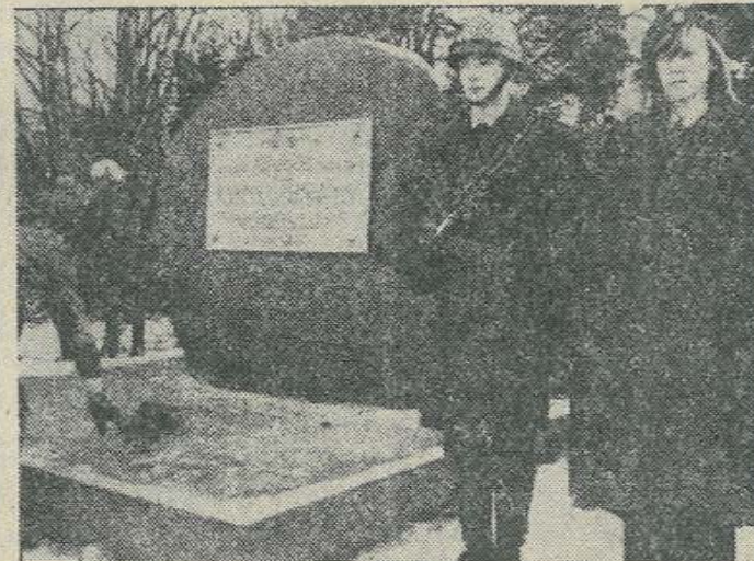
Przed tablicą pamiątkową ku czci harcerzy — powstańców wielkopolskich.