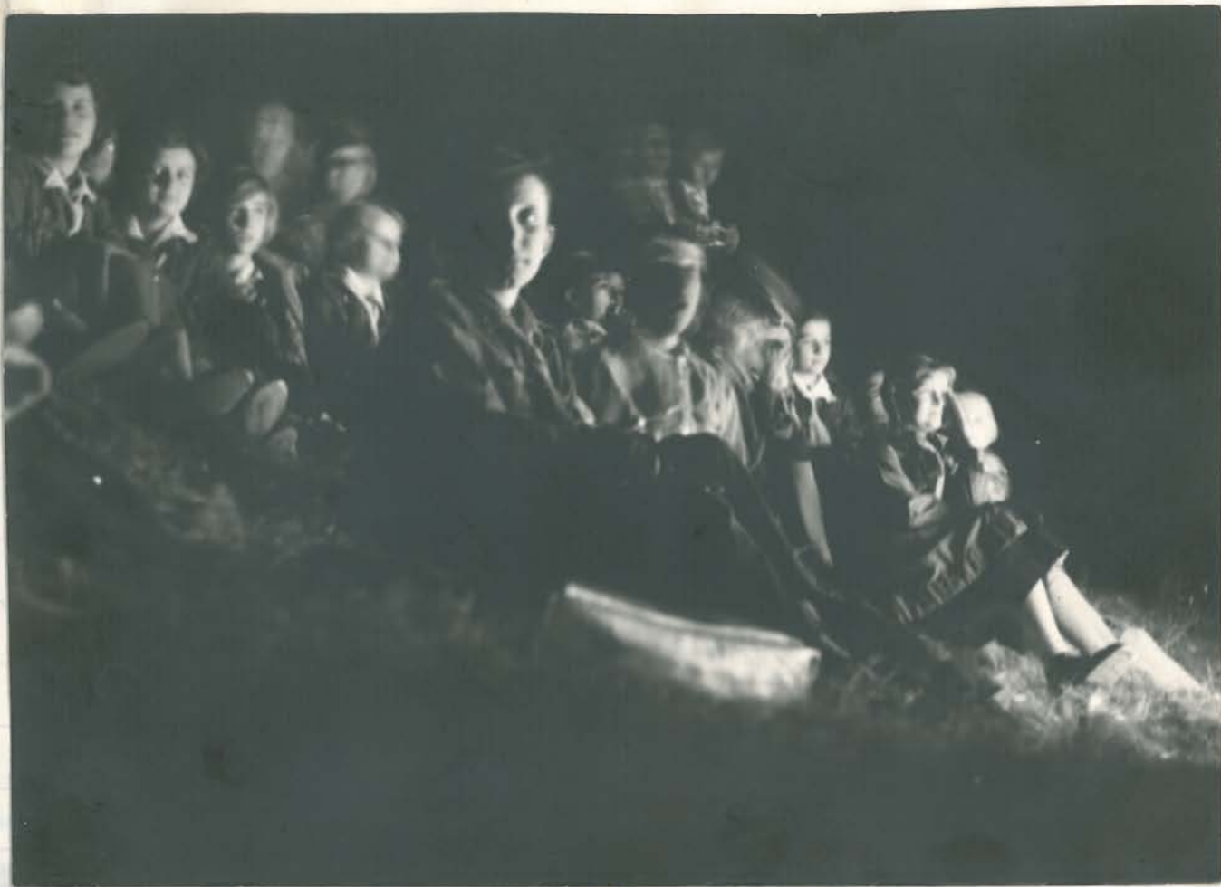
Īry oguistku na pasovamim zuchioz n mēprie diua 11. paxdziermka 1959.5.