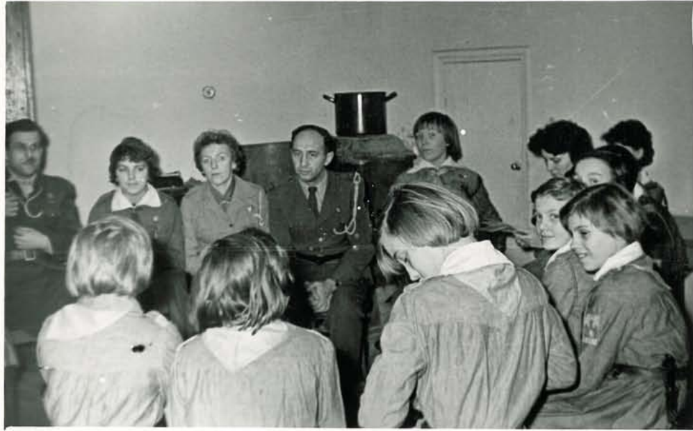
"Gazda" dl. Komendant lufca garzoi o kuczia mareviciu