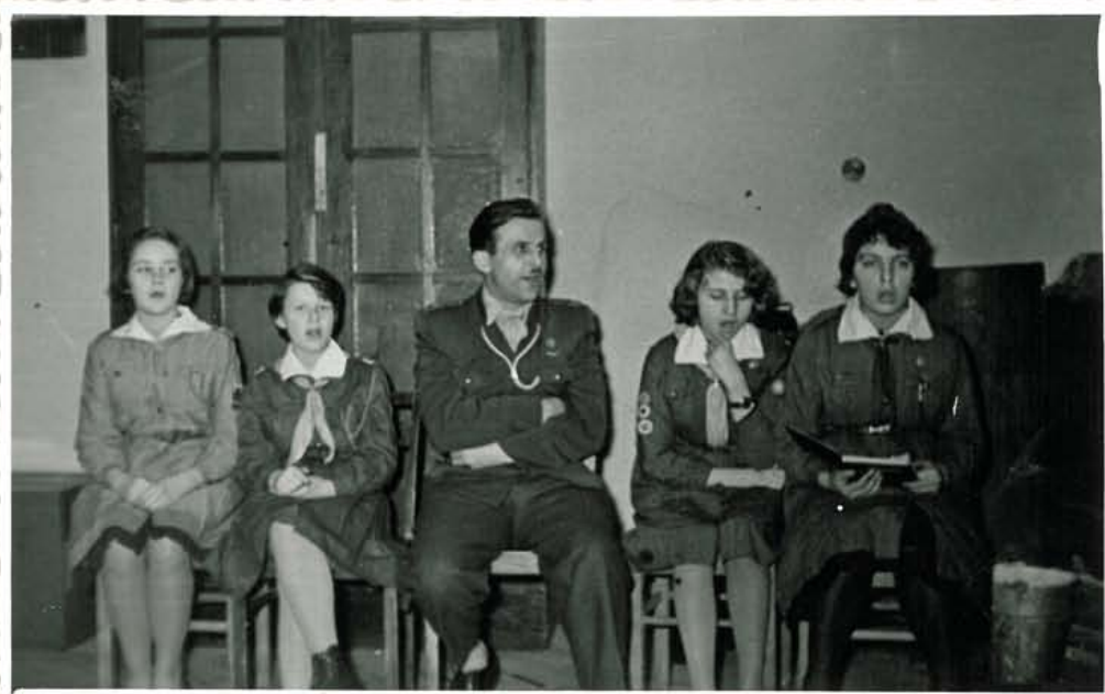
Dl. sergenty o osyvie